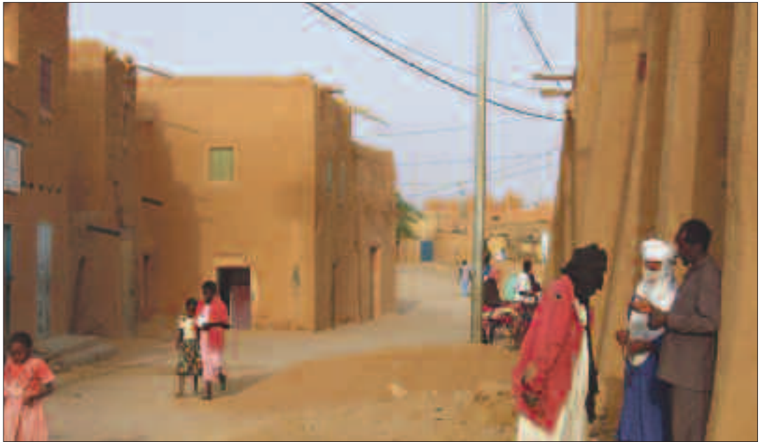
Depuis la mise en œuvre de la loi contre le trafic d'êtres humains de 2015 au Niger, les passeurs ont tracé de nouvelles routes encore plus périlleuses pour les migrants.

Pour enrayer la venue de migrants d'Afrique de l'Ouest, voire d'Afrique centrale en Europe, via la Lybie, l'UE fait pression depuis quelques années sur les pays de transit. A la fin de l'année 2015, l'UE a ainsi créé le Fonds fiduciaire d'urgence pour l'Afrique (FFU) – un programme d'aide d'un montant de deux milliards de dollars visant à s'assurer la coopération des pays africains dans la lutte contre la migration illégale. Porte du sud-lybien et identifié comme l'un des cinq «pays partenaires prioritaires», le Niger a reçu en 2016 la visite de délégations de haut niveau venues d'Allemagne, d'Italie et des Pays-Bas, et la promesse de recevoir 610 millions de dollars au titre de l'aide au développement, notamment pour sa participation à la répression du trafic de migrants par les réseaux de passeurs. Depuis, les routes qui partent d'Agadez pour le nord du pays sont de plus en plus surveillées par des patrouilles de soldats, entraînant la prise d'un surplus de risques pour les candidats au départ. Basé dans cette ville et observateur de tous ces changements, Ibrahim Manzo Diallo, directeur du journal Air Info et de la radio Sahara FM répond à nos questions.